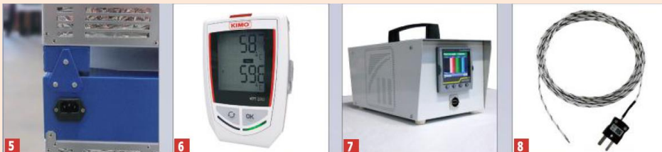
5 Rögzítő készlet