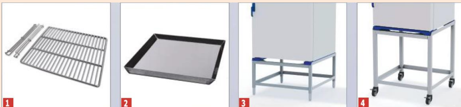
1 Polc vezető rudakkal