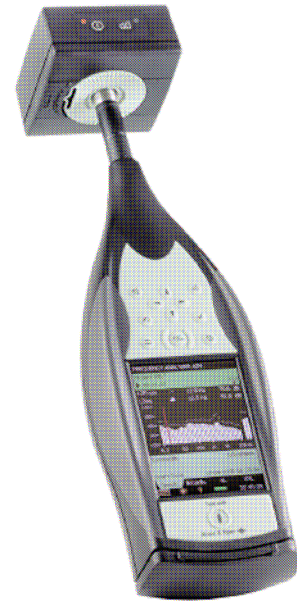
2. ábra a 4231 kalibrátor a 2250 hang analízátorra helyezve A kalibrátor tömegközéppontja közel esik a behelyezett mikrofnhoz, így stabil

A hang mérőeszköz érzékenysége ezután addig változtatható, míg a korrekt értéket nem mutatja. A kalibrátor önmagától kikapcsol, ha a mikrofonról levesszük. Veleszállított tartozék a bőrtok, amit nem kell a használathoz levenni.